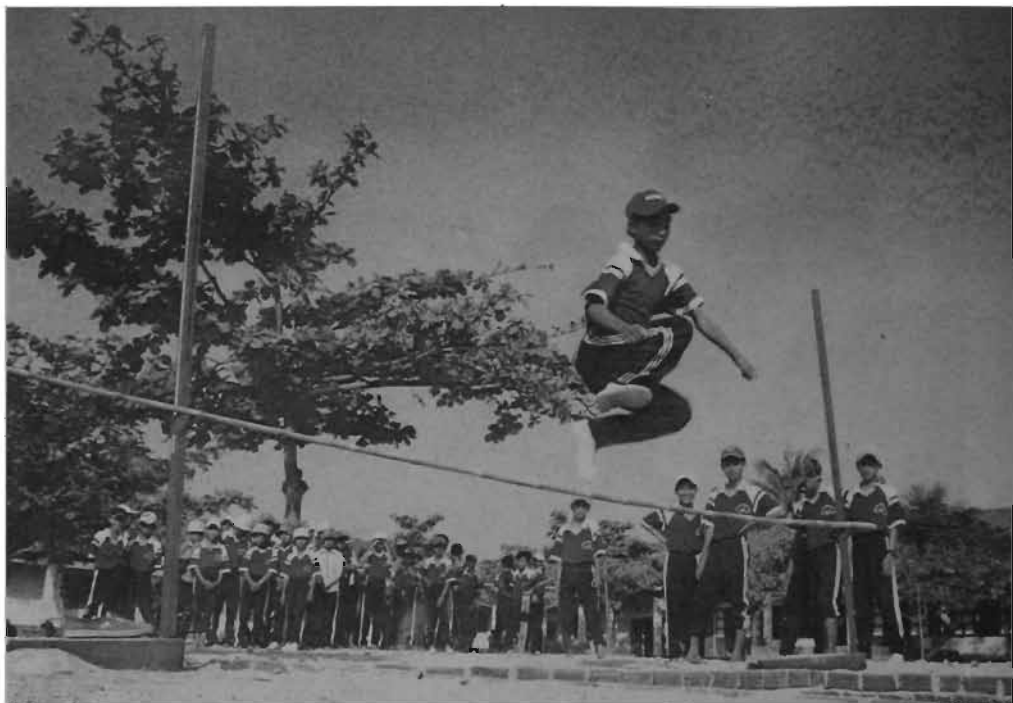
Tích cực rèn luyện thân thể.

– Vận động bạn bè, người thân thực hiện tốt nghĩa vụ bảo vệ Tổ quốc.