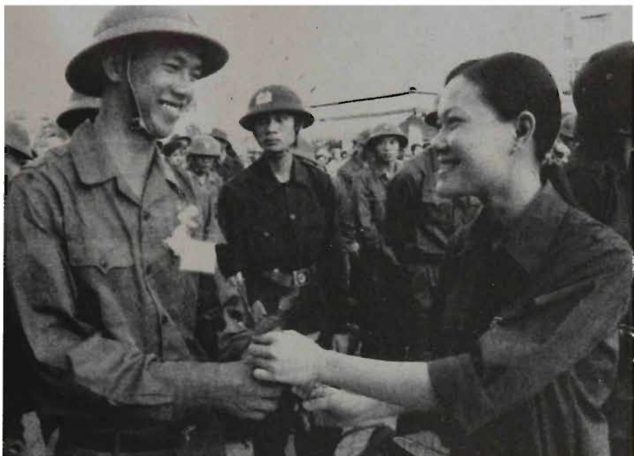
Thanh niên lên đường làm nghĩa vụ bảo vệ Tổ quốc.

Là những công dân trẻ tuổi yêu nước, thanh niên học sinh chúng ta có trách nhiệm :