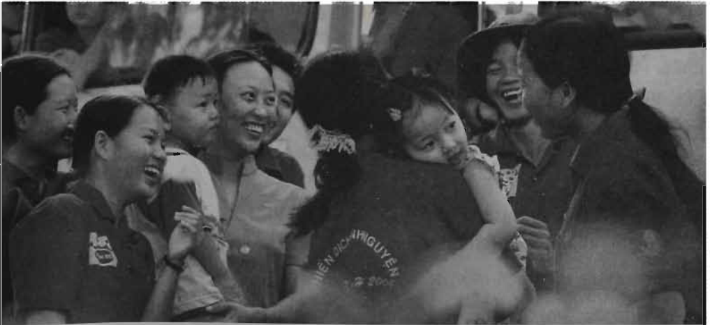
Thanh niên tình nguyện – đi dân nhớ, ở dân thương.

– Tích cực tham gia các hoạt động tập thể, hoạt động xã hội do nhà trường, địa phương tổ chức ; đồng thời vận động bạn bè và mọi người cùng tham gia.