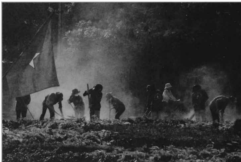
Thanh niên học sinh tham gia hoạt động bảo vệ môi trường

– Bảo vệ và sử dụng tiết kiệm tài nguyên thiên nhiên : bảo vệ nguồn nước, bảo vệ các giống loài động, thực vật ; không đốt phá rừng, khai thác khoáng sản một cách bừa bãi ; không dùng chất nổ, điện,... để đánh bắt thủy, hải sản ; không tham gia vào các hành vi vận chuyển, mua bán động vật quý hiếm.