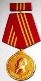
HUÂN CHƯƠNG HỒ CHÍ MINH