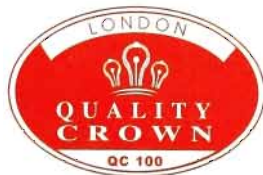
VƯƠNG MIỆN KIM CƯƠNG CHẤT LƯỢNG QUỐC TẾ