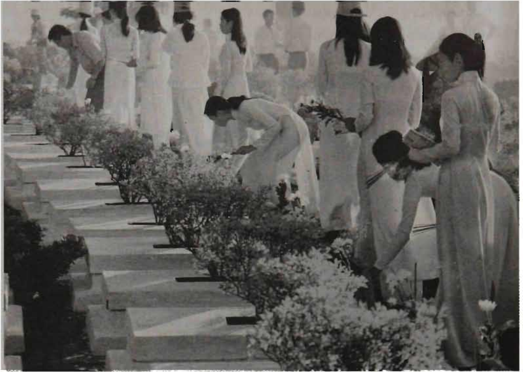
Thanh niên học sinh thăm viếng nghĩa trang liệt sĩ.